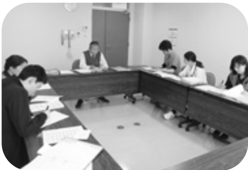
施設カンファレンス

目標を持ち、生き活きと生活されている姿は、何よりもうれしく励みになります。今後も、ご家族との絆を大切に、地域の高齢者を支える役割を担っていきたいと思います。