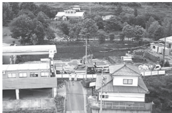
工事の状況(7月10日現在)

工事期間中、皆様には大変ご迷惑、ご不便をおかけしますが、ご理解ご協力ください。よろしくお願いいたします。