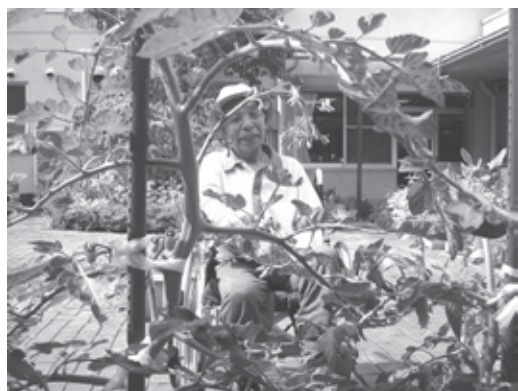
利用者様による野菜の生育チェック、職員も気が抜けません。

「いこい」の中庭には、猫の額ほどの小さな菜園があります。そこには、今年も利用者様のご指導の下、トマトやキュウリを植栽しています。これから収穫の季節となりますが、毎日楽しみに手入れをしています。収穫した野菜は、新鮮なうちに調理し、