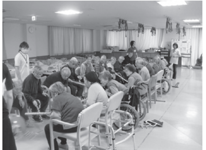
ベンチサッカー熱戦中

依田窪南部地域(長和町、上田市武石地域)では、通所リハビリ施設は「いこい」だけです。これからも、在宅生活支援の一環としてひとりでも多くの皆様にリハビリを提供して行きたいと思っておりますので、皆様のご利用をお待ちしております。